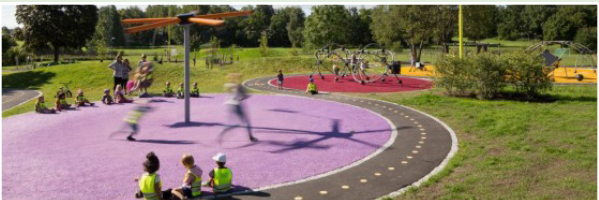
© Nyrens Naelsta AMÉNAGEMENT D'AIRES DE JEUX